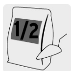
Capacidad 1/2 saco de cemento