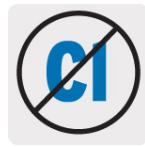
Reduce olor, color y sabor a cloro