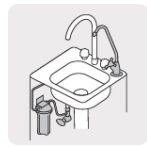
Purificador bajo tarja