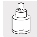
Cartucho cerámico (CARMO-20)