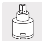
Cartucho cerámico (CARMO-1)