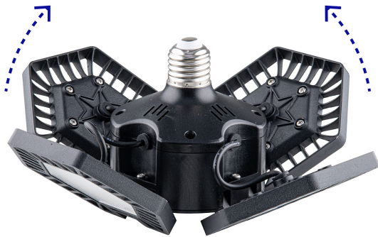
Paneles abatibles 90°