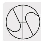
Punta Split Point